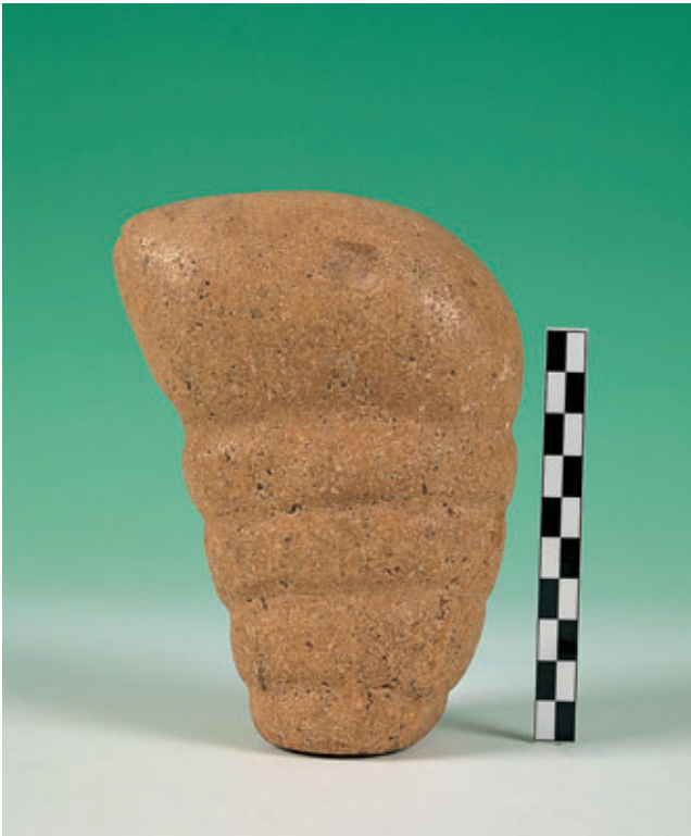
Fig. 74. Ídolo de Tahiche (Tegui).