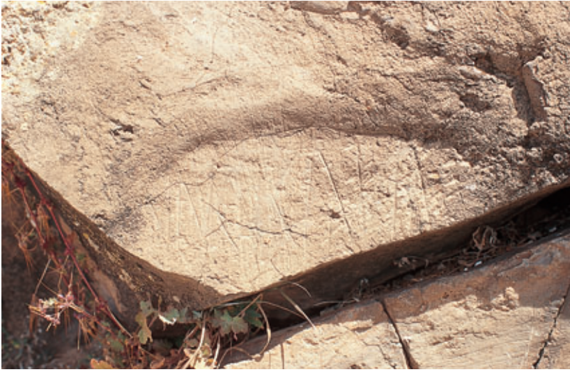
Fig. 85. Peña del Letrero o del Rubio (Valle de Zonzamas, Tegui) con escritura líbico-canaria.