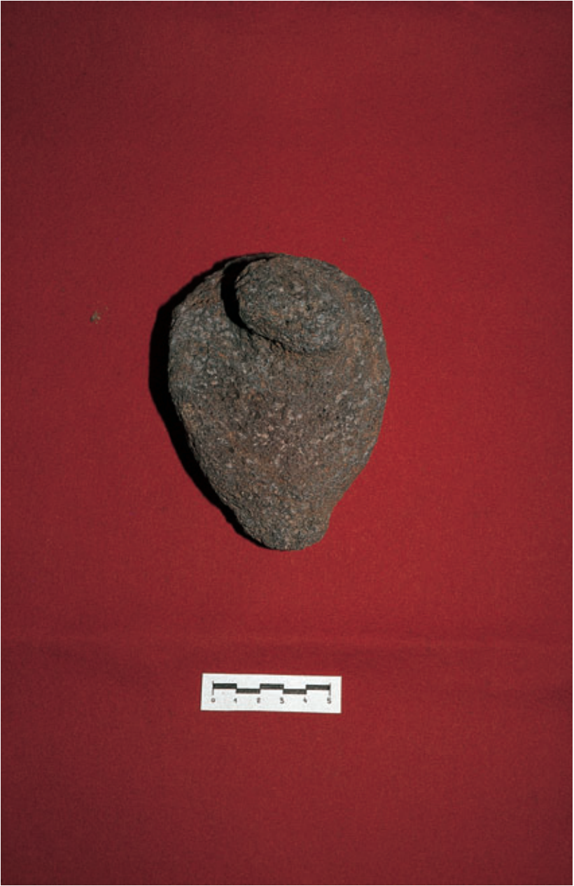
Fig. 76. Objeto anicónico, ¿ídolo?, procedente de Zonzamas (Teguisse). Castillo de San Gabriel. Arrecife.