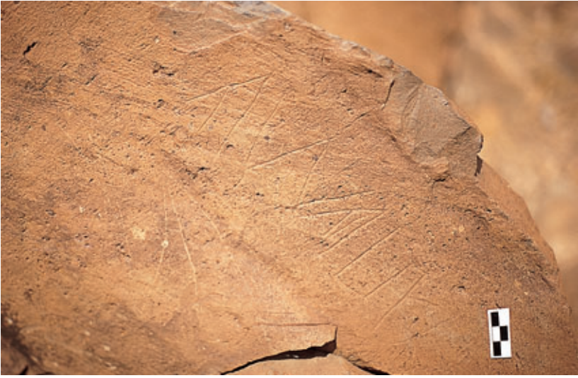
Fig. 88. Inscripción líbico-canaria de Manguia (Guatiza, Teguiise).