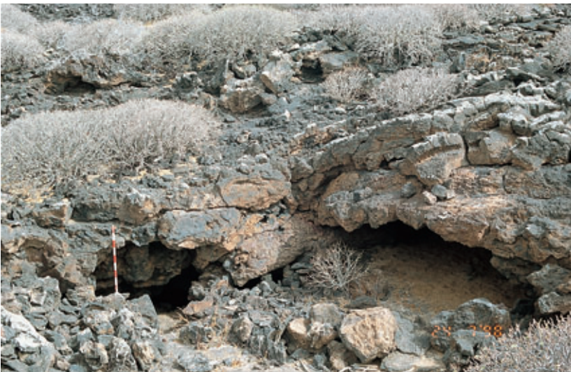
Fig. 90. Entrada a la Cueva de la Chifletera (Yaiza).