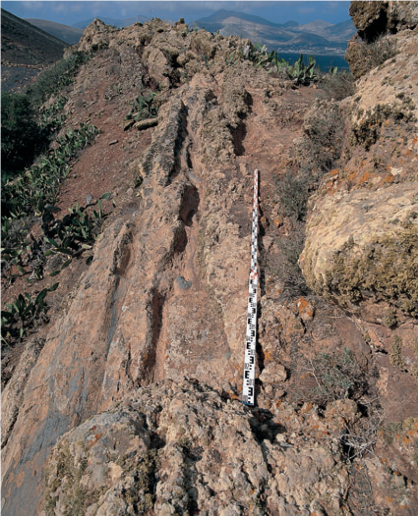
Fig. 59. Vista de conjunto de los canales de la Montaña de Guardilama (Yaiza).