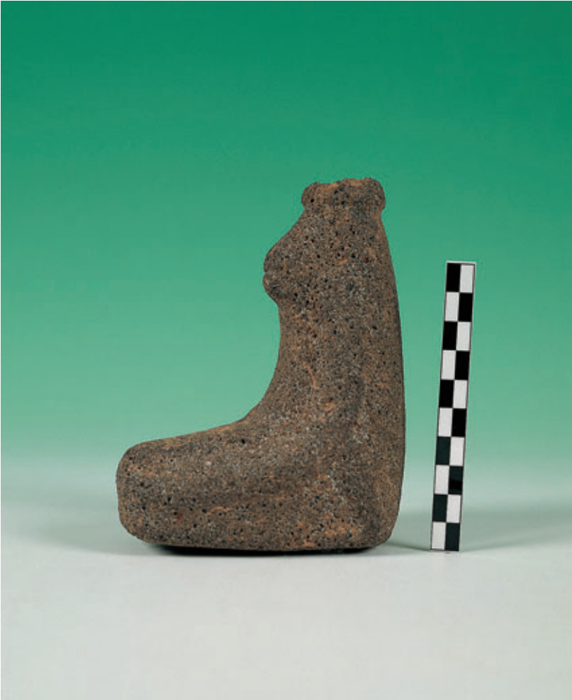
Fig. 68. Perfil del ídolo antropomorfo de Zonzamas (Teguise).