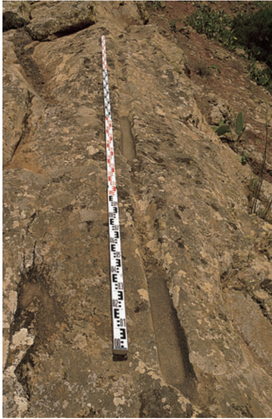
Fig. 60. Vista de conjunto de los canales de la Montaña de Guardilama (Yaiza).