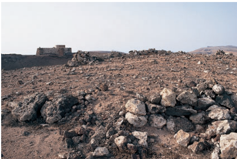
Fig. 98. El Volcán del Guanapay (Teguisse). Al Norte, el emplazamiento del castillo actual de Santa Bárbara. Al Sur, probable ubicación de la Torre de Lancelotto Malocello.