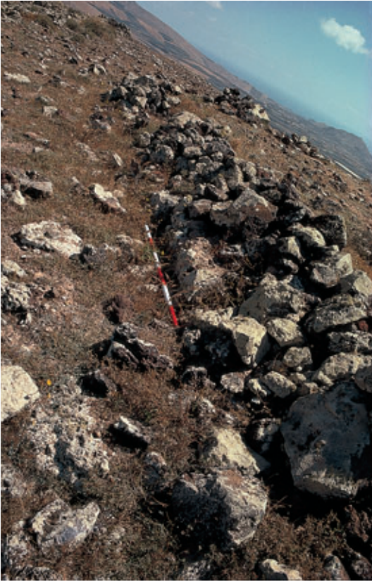
Fig. 99. Restos de estructuras que podrían corresponder a los cimientos de la torre del genovés L. Malocello, en el Volcán del Guanapay (Teguise).