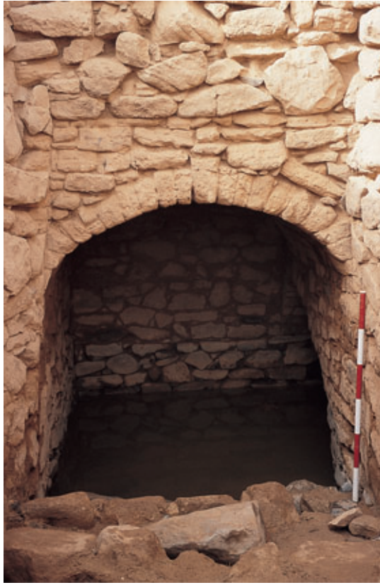
Fig. 101. Pozo de San Marcial del Rubicón (Yaiza)