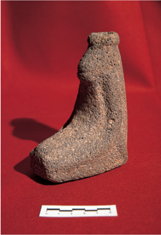
Fig. 69. Vista angular del ídolo antropomorfo de Zonzamas (Teguisse).