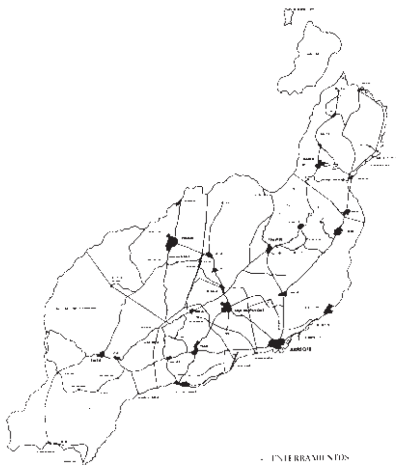
Mapa nº 2. Distribución de los enterramientos de los majos .