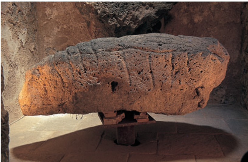
Fig. 71. Vista lateral del Ídolo zoomorfo de Zonzamas (Teguisse). Castillo de San Gabriel (Arrecife).