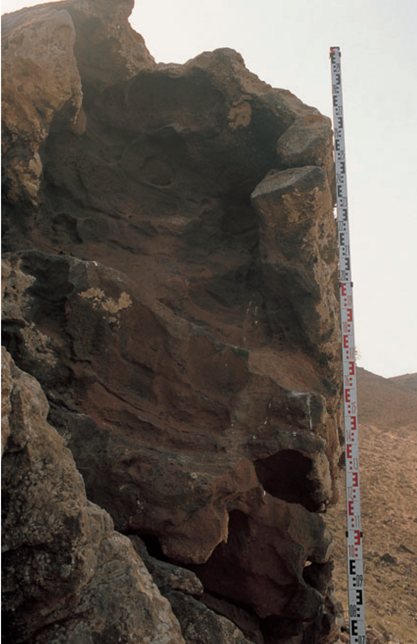
Fig. 67. Litófono de Sóo (Teguisse).