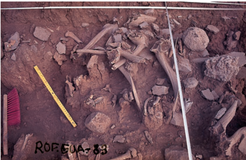
Fig. 94. Enterramiento donde se muestra la disposición de los cuernos-trofeo del yacimiento funerario de los Roferos del Castillo del Guanapay (Teguisse).