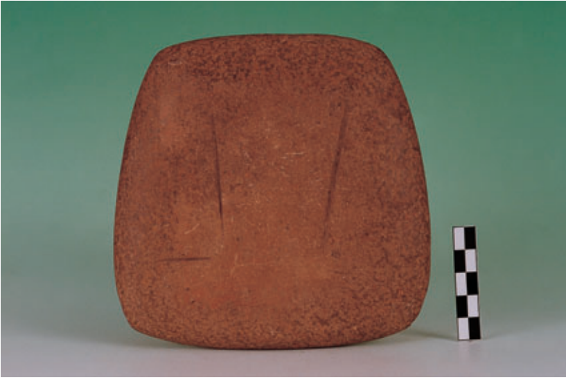
Fig. 83. Placa de piedra, procedente del yacimiento de Zonzamas (Teguise).