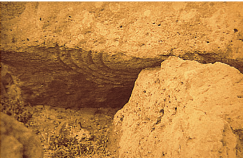
Fig. 79. Disposición de la estela de Zonzamas, junto a la muralla de Zonzamas.