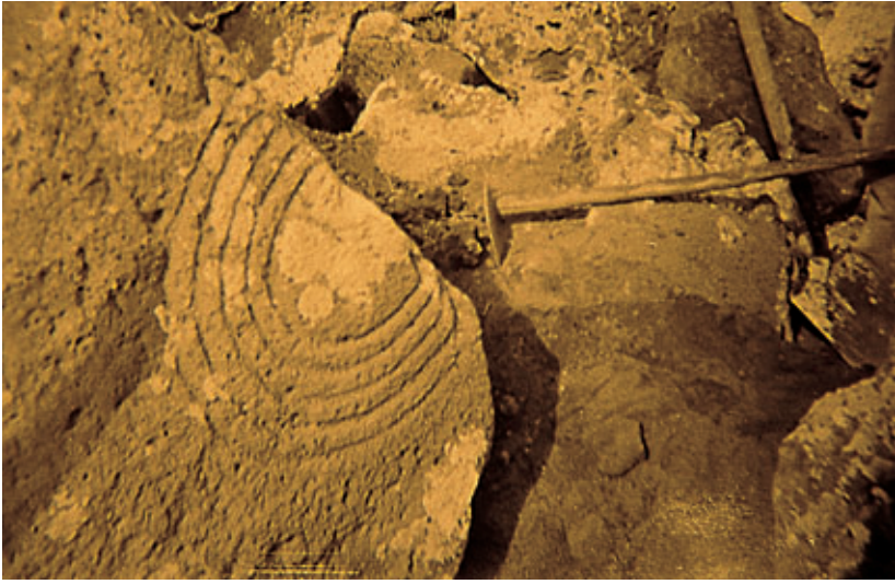
Fig. 80. Detalle del proceso de extracción de la estela de la muralla que rodea la Cueva del Majo o Palacio de Zonzamas.