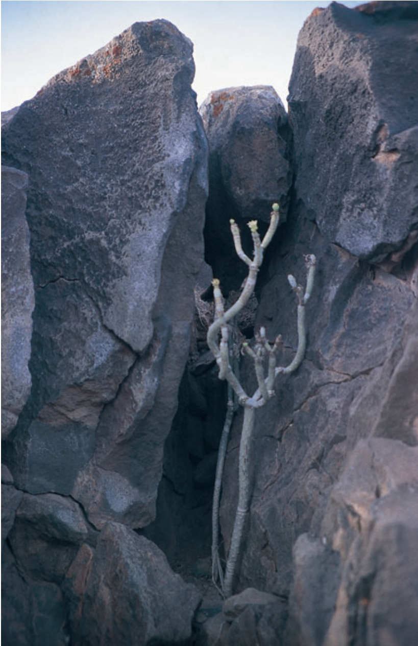
Fig. 65. Litófono de la Peña de Luis Cabrera (Guatiza, Teguisse).