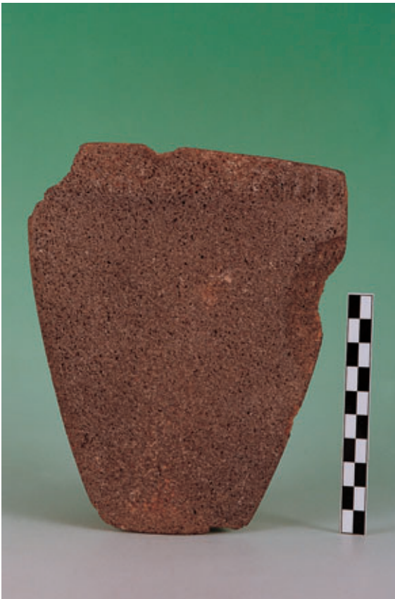
Fig. 82. Placa de piedra, procedente del yacimiento de Zonzamas (Teguisse).