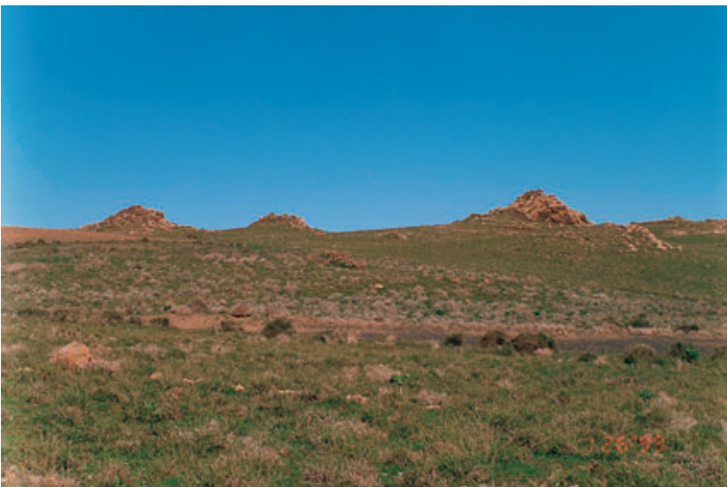
Fig. 84. Afloramientos rocosos en el Valle de Zonzamas. Son los emplazamientos característicos de los grabados rupestres.