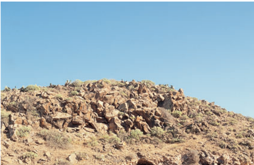
Fig. 87. Peña de Mangua. Yacimiento rupestre de Guatiza (Tegui).