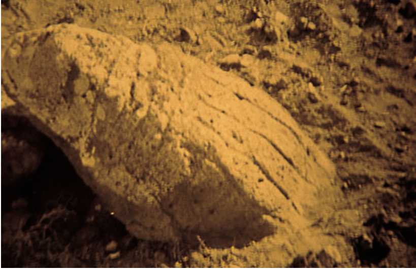
Fig. 73. Ídolo zoomorfo tal como se encontraba en el yacimiento de Zonzamas (Tegui).