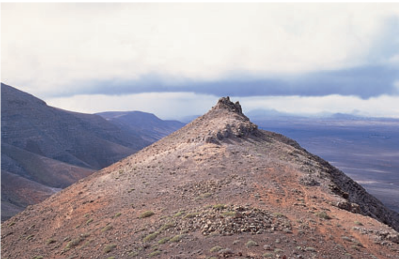
Fig. 96. Emplazamiento del probable túmulo funerario del yacimiento de El Castillejo (Famara-Teguisse).