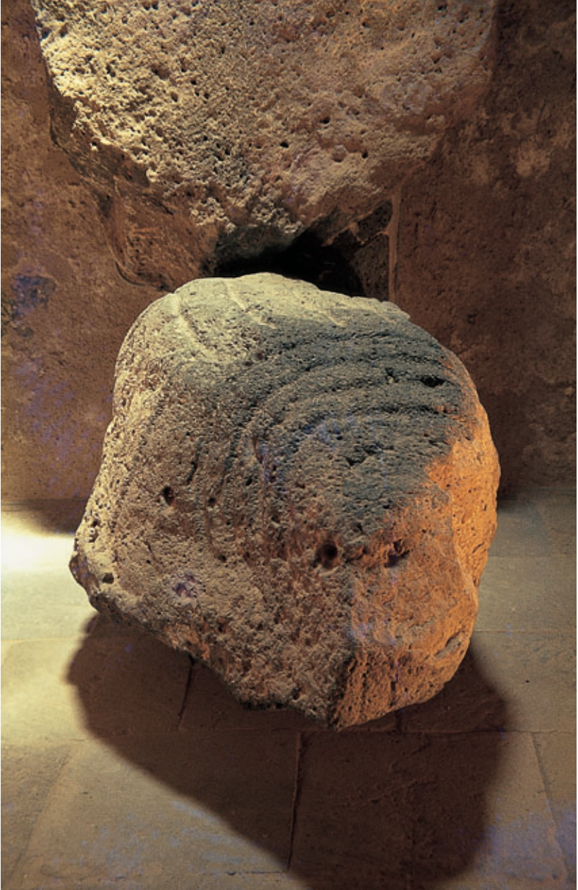
Fig. 72. Vista de frente del ídolo zoomorfo de Zonzamas (Teguise). Castillo de San Gabriel (Arrecife).