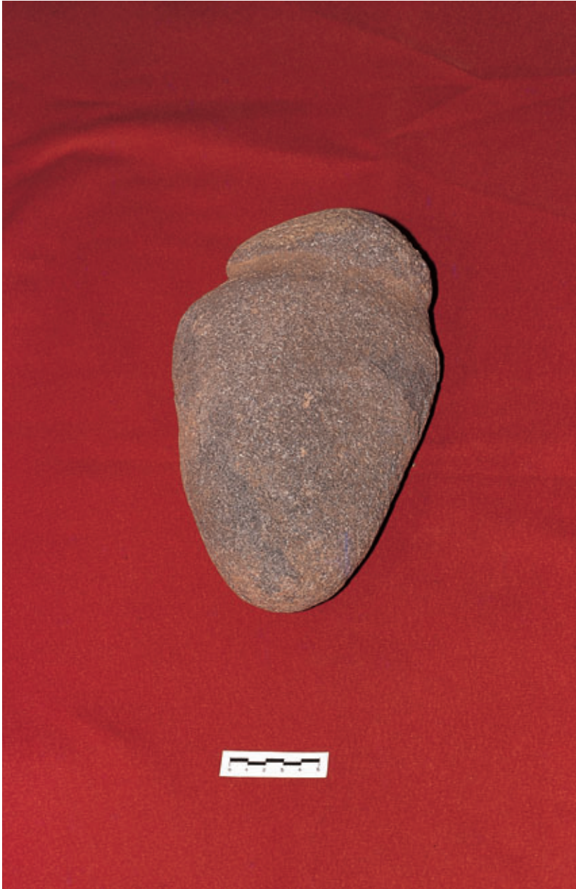
Fig. 77. Objeto anicónico, ¿ídolo?, procedente de Zonzamas (Teguisse). Castillo de San Gabriel. Arrecife.