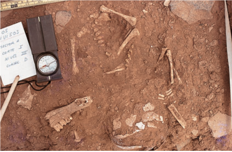
Fig. 95. Enterramiento infantil de Los Divisos, en la ladera del Castillo de Guanapay (Teguisse).