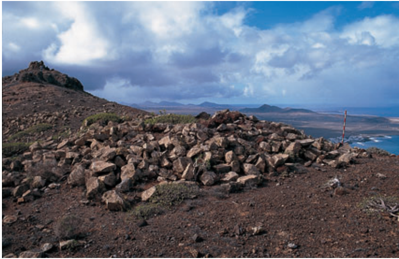
Fig. 97. Estructura de un probable túmulo funerario del yacimiento de El Castillojo (Famara-Teguisse).