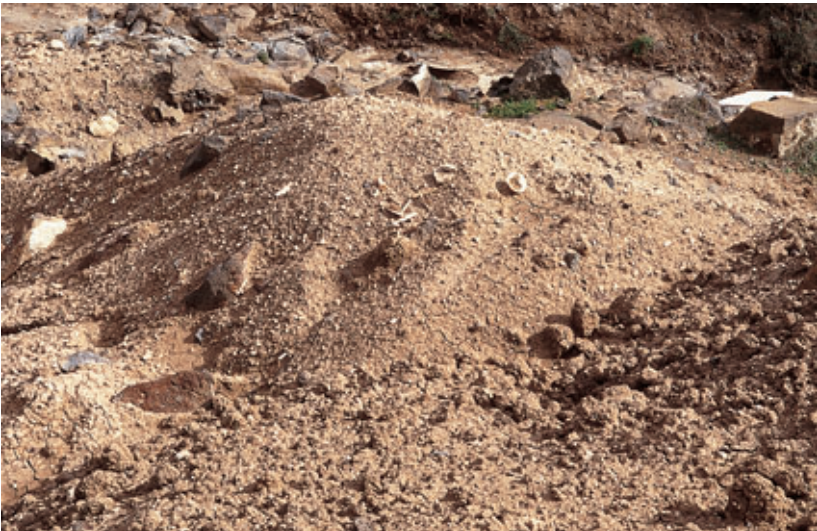
Fig. 64. Restos destruidos de un recinto ritual. Se aprecian fragmentos óseos de animales pequeños; también malacológicos, cerámicos y líticos. Risco de las Nieves (Teguise).