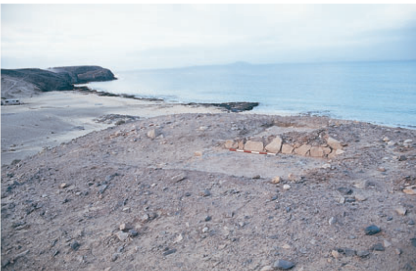
Fig. 100. Vista de los restos de la torre y emplazamiento del asentamiento franconormando de San Marcial del Rubicón (Yaiza).