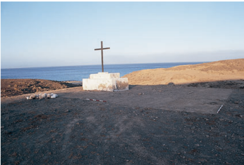
Fig. 102. Emplazamiento de la Iglesia-Catedral del Rubicón (Yaiza).