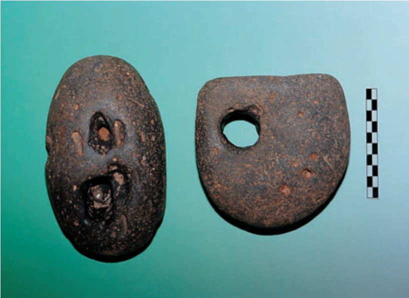
Fig. 78. Piedras horadadas procedentes de Zonzamas (Teguise). Castillo de San Gabriel. Arrecife.