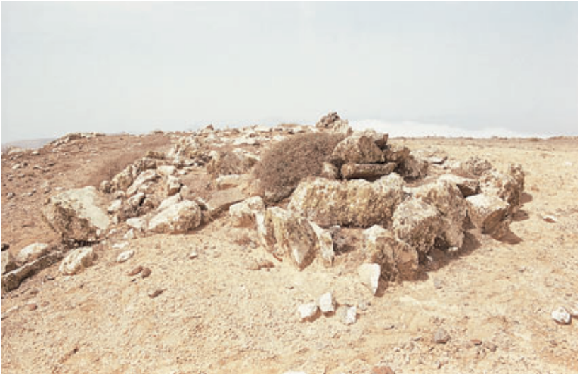
Fig. 63. Estructura cuadrangular que pudo estar destinada a algún ritual sacrificial de animales. Risco de las Nieves (Teguise).