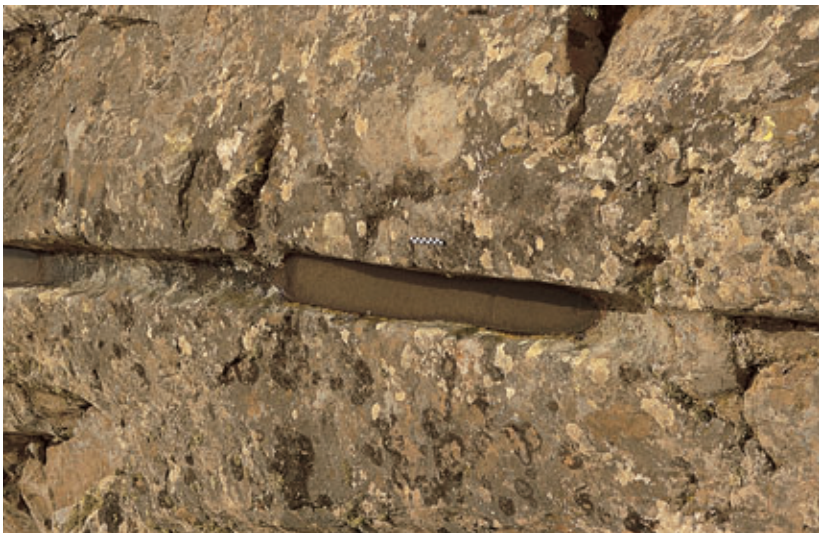
Fig. 61. Detalle con agua del canal principal de la Montaña de Guardilama (Yaiza).