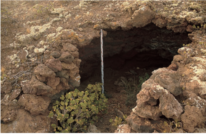
Fig. 93. Cueva o solapón de Caldera Quemada (Tinajo), posible recinto funerario.