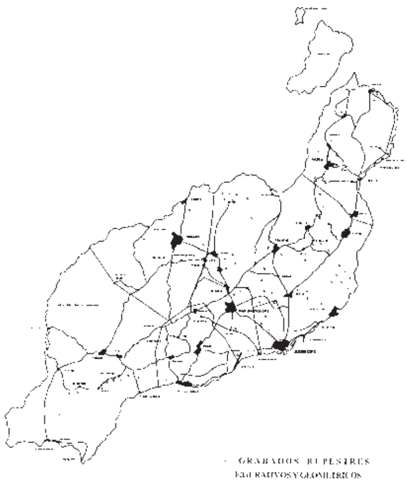
Mapa nº 3. Distribución de las estaciones de grabados rupestres figurativos y geométricos.